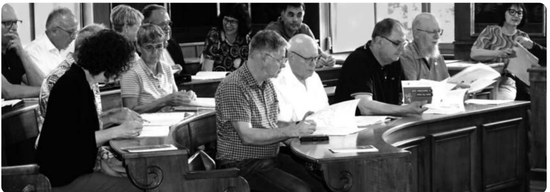
Die Jahresrechnung und der Rechenschaftsbericht 2025 wurden von den Ratsmitgliedern einstimmig genehmigt

Erfreulich rückläufig ist die Zahl der Kirchenglieder. «Schön zu sehen ist, dass die Kirchengliederzahl wieder unter das Niveau von 2022 gesunken