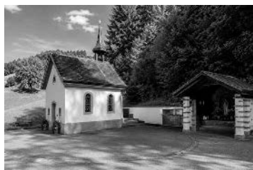
Wallfahrtsort Luthern Bad