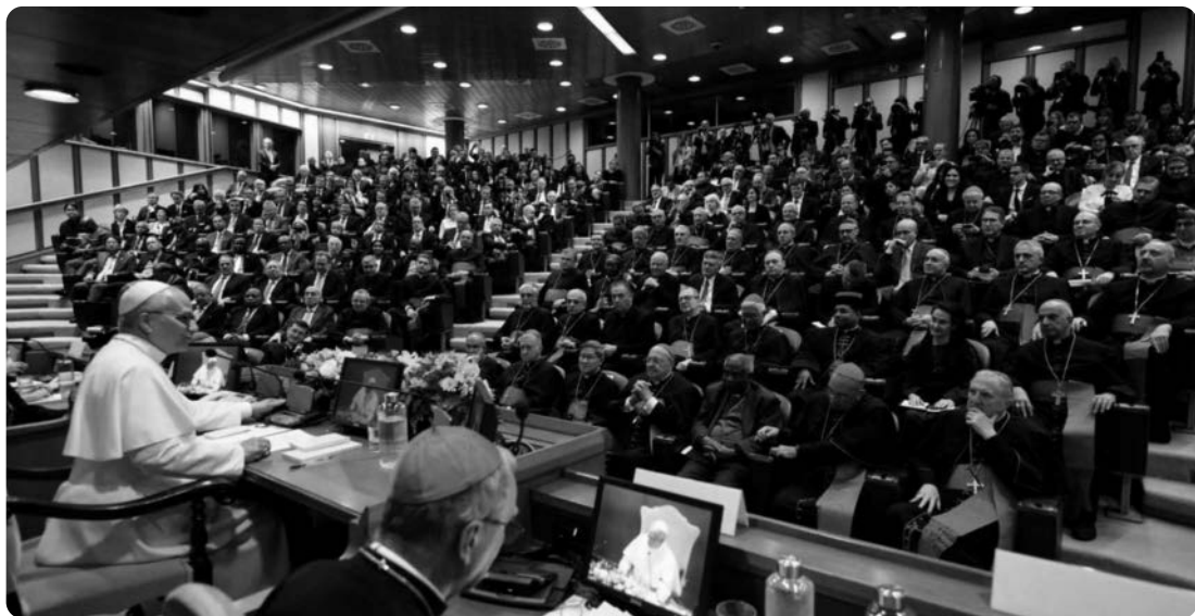
Präsentation der Enzyklika «Magnifica humanitas» von Papst Leo XIV. am 25. Mai 2026 in der Synodenaula im Vatikan