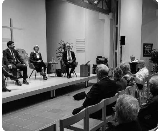
Der zweite Anlass war eine Podiumsdiskussion zur Frage des Gewalt- und Friedenspotenzials in den Religionen. Auf dem Podium sassen je eine Vertretung des Christentums, des Islams und des Judentums. Die Diskussion wurde unter fachkundiger Begleitung eines Journalisten mit Nahost-Erfahrung geführt