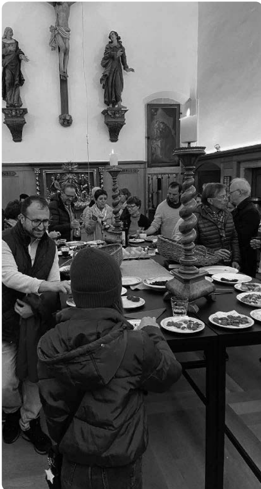
Den Auftakt bildete das interreligiöse Friedensgebet mit anschliessender Agape in der Kapuzinerkirche Stans

Mit drei besonderen Anlässen lud die Arbeitsgruppe «Woche der Religionen Nidwalden» auch dieses Jahr wieder zu Begegnung, Austausch und Staunen ein.