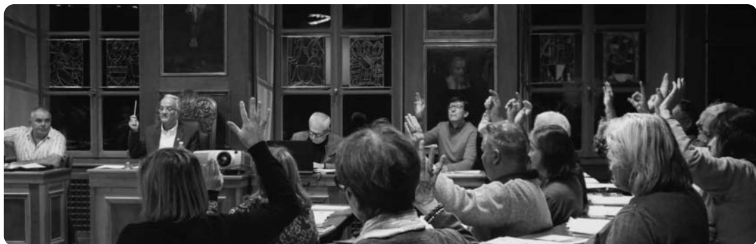
Die Räte genehmigten einstimmig das Budget 2026