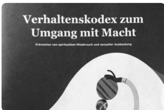
Titelseite des Verhaltenskodex (Ausschnitt).

Gemeinsam haben Iten und Loppacher 2021 in einem partizipativen Prozess einen Verhaltenskodex zur Prävention von Missbrauch und Ausbeutung erarbeitet. Er ist überschrieben mit «Verhaltenskodex zum Umgang mit Macht. Prävention von spirituellem Missbrauch und sexueller Ausbeutung». Nun liegt er in gedruckter Form vor. Als Arbeitsinstrument für kirchliches Personal sowie