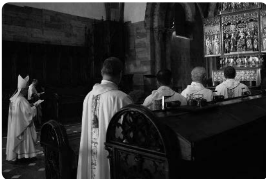
Die neuernannten Domherren nehmen ihre Plätze im Chorgestühl der Kathedrale ein.

Beim Domkapitel handelt sich um ein Kollegium von Priestern an Kathedralkirchen. Sie tragen eine Amtstracht, die je nach Bistum variiert. Im Bistum Chur gehört dazu u.a. ein Brustkreuz, das an einer Kordel befestigt ist und das von den Domherren in feierlichen Gottesdiensten getragen wird. In seiner ursprünglichen Form geht das Domkapitel auf das Frühmittelalter (6./7. Jh.) zurück. Es hatte seine Blütezeit in der Zeit vom Mittelalter bis zum 19. Jh. und nahm oftmals erheb-