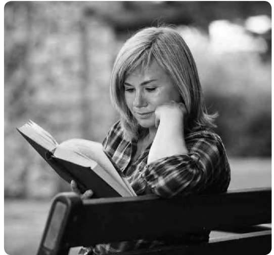
Ein Mal in aller Ruhe ein Buch lesen. Die «Ferien für Nidwaldner Frauen» wirken Wunder.

In diesem Moment selber Ferien zu organisieren ist ein Ding der Unmöglichkeit. Doch Ferien wirken häufig Wunder. Das zeigen Aussagen von Teilneh-