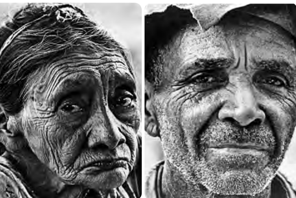
Zuwanderer und ihre Schicksale – zu sehen im Kollegi Stans, Mensa.

mehr: siehe Seite nebenan und www.woche-der-religionen.ch.vu