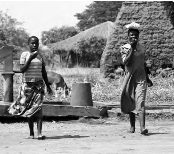
Unterwegs zur Schule - ohne Kickboard und Schulrucksack, dafür mit Löffel und Kugelschreiber

Der Löffel und der Kugelschreiber sind Symbole für das, was die Kinder bitter nötig haben und was Missio vermitteln möchte. Der Löffel steht für die materielle Hilfe: Schulkinder bekommen vor dem Unterricht eine einfache Mahlzeit. Missio möchte aber ein Fundament für das Leben geben, welches weit über die alltäglichen Bedürfnisse hinausgeht: Dafür steht symbolisch der Kugelschreiber. Weil auch Menschen, die unter einfachsten Verhältnissen leben müssen, sich bilden wollen und einen spirituellen Hunger und Durst verspüren.